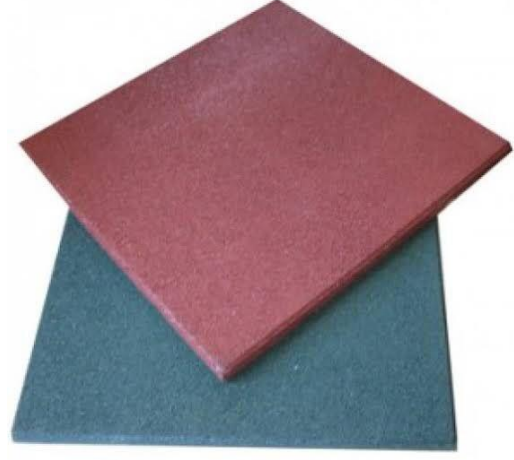
(Zemin Kaplama Malzeme)

Ege Karma Kauçuk yeni kurulmuş olan bölgesinde tek kauçuk zemin kaplama malzeme üreten tesistir. Araç lastiklerinden içindeki çelik tellerin ayrıştırılıp, ardından hurda lastiklerin dev kırıcıda parçalanarak 1 ile 4 milimetre arasında granül haline getirilip, bu granüllerin park ve bahçelerde yer kaplama malzemesi üretilmesi faaliyetiyle işigal etmektedir.